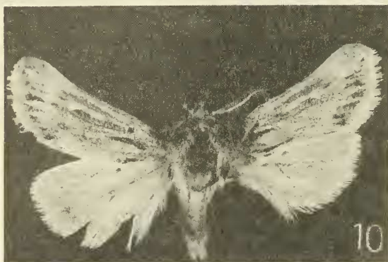
Figuras 7-10. Aspecto general del adulto. 7. P. janae n.sp. 8. P. lineifera (Blanchard). 9. P. meditata Koehler. 10. P. sanctisebastiani Koehler.